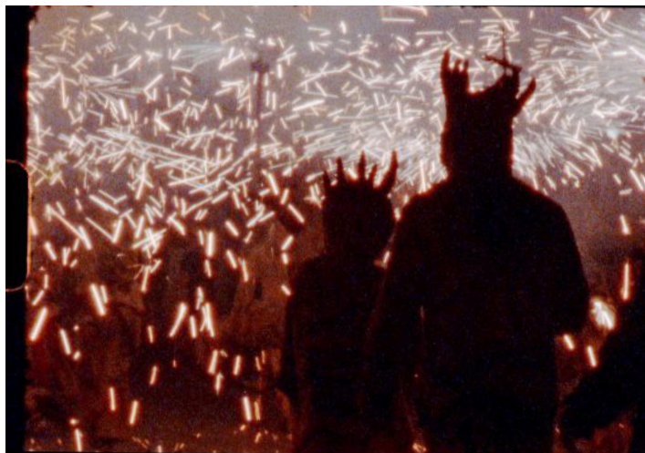
Pol Merchan. La llum que cobreix les ferides . Video monocanal HD, 2024

Los piratas, faunos y demonios que convoca Pol Merchan no tienen nada de fantasía, lo tienen todo de real. Proviene de épocas y lugares distintos, pero están reunidos alrededor de una misma mesa, charlando con intensidad sobre cómo ha sido el largo camino —con sus luces y sus sombras— que les ha permitido llegar hoy aquí. Es invocando esa magia, sugiriendo aquello que aparentemente no puede ser, que se consigue construir una realidad deseada, consciente, radical y verdaderamente posible. Es en la ficción, como estrategia, donde se halla el potencial de realidad. Los tres cortometrajes de Pol Merchan que se reúnen en Piratas, faunos, demonios conforman una trilogía que es, al mismo tiempo, un camino de ida y vuelta en la búsqueda de un reflejo y una genealogía de lo andrógino y de la disidencia sexual y de género que acompaña y enriquece el proceso de transformación del propio Merchan.